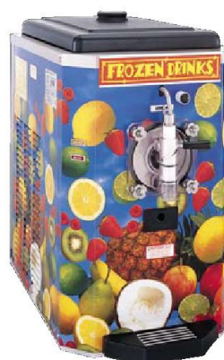
Option: Ausführung mit Dekorverkleidung