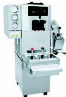
Optionaler Wagen mit hinterer Tür, seitliches und Fronttoppingfach