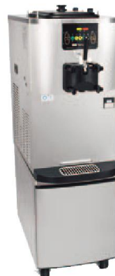
Optionaler Wagen mit Rollen und Fronttür.

Die Temperatur des Vorratsbehälters wird permanent angezeigt und gewährleistet somit die sichere Mixaufbewahrung.