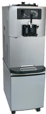
Abb. Mit optionalen Unterschrank auf Rollen mit Vordertüre