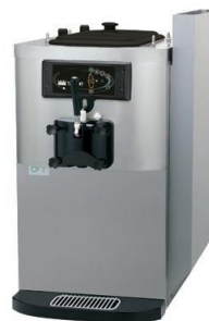
Abb. mit optionalem Unterschrank auf Rollen